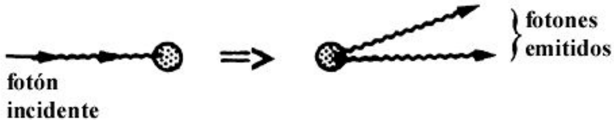
Figura 27. Así explica Einstein la fluorescencia. Un átomo absorbe un fotón y luego emite dos o más fotones. De este modo, la energía que absorbió (la del fotón incidente) la comparten los dos fotones emitidos.

Este acuerdo apoya el modelo de Einstein en el cual los cuantos de luz, o fotones, se absorben o emiten en unidades enteras.